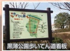
黒薄公園歩いてん道看板